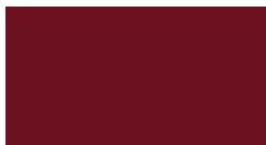
VSR 330 RAL 3011