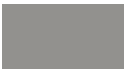
VSR 907 RAL 9007